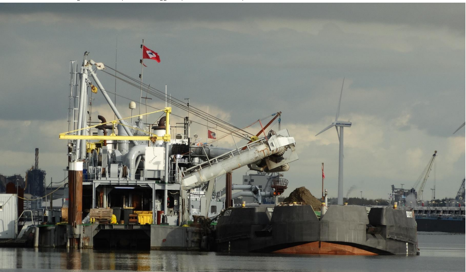
Bakkenzuiger Alouette op locatie Baggerdepot Hollandsch Diep